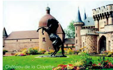
Château de la Clayette